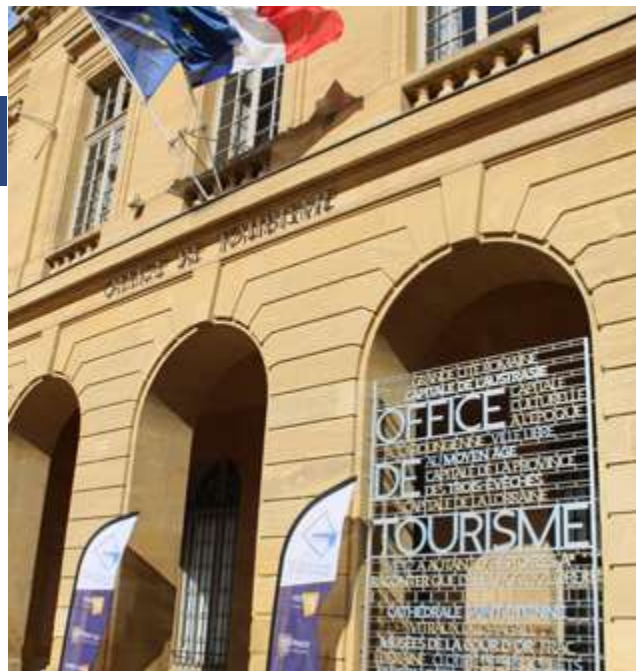
Het V.V.V. - Bureau Inspire Metz