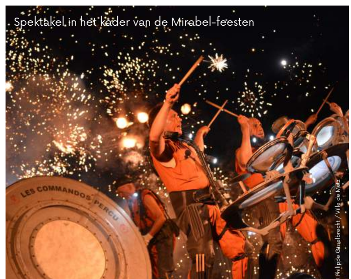
Spektakel in het kader van de Mirabel-feesten